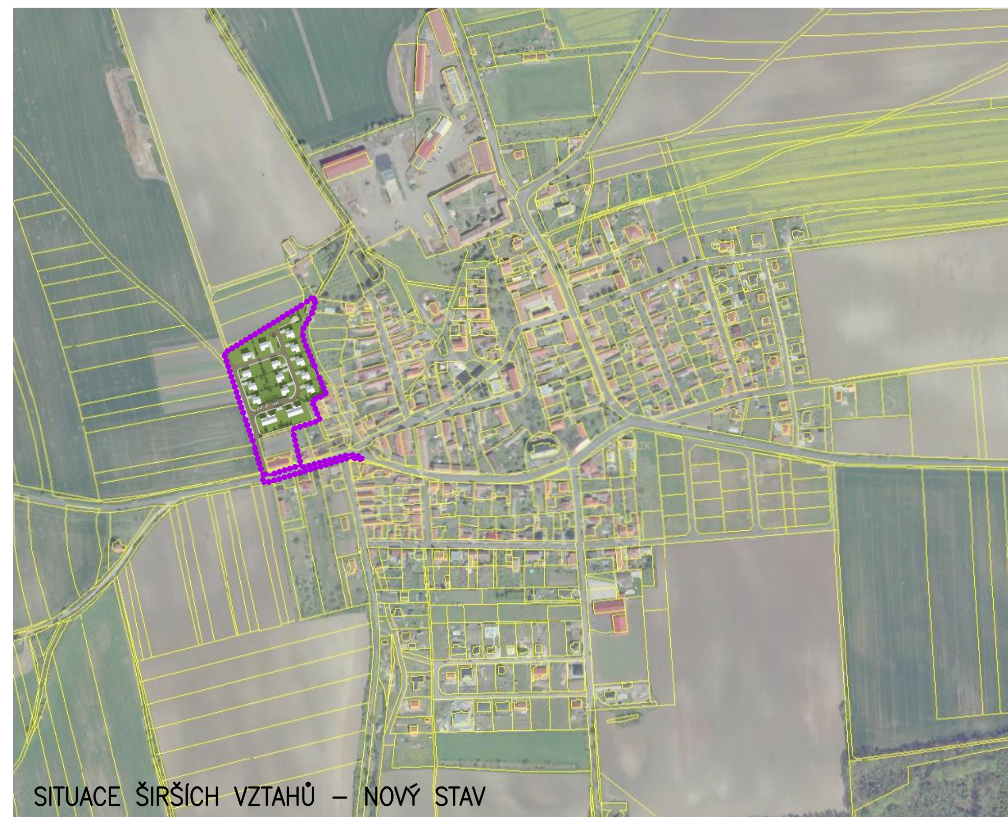
SITUACE ŠIRŠÍCH VZTAHŮ – NOVÝ STAV