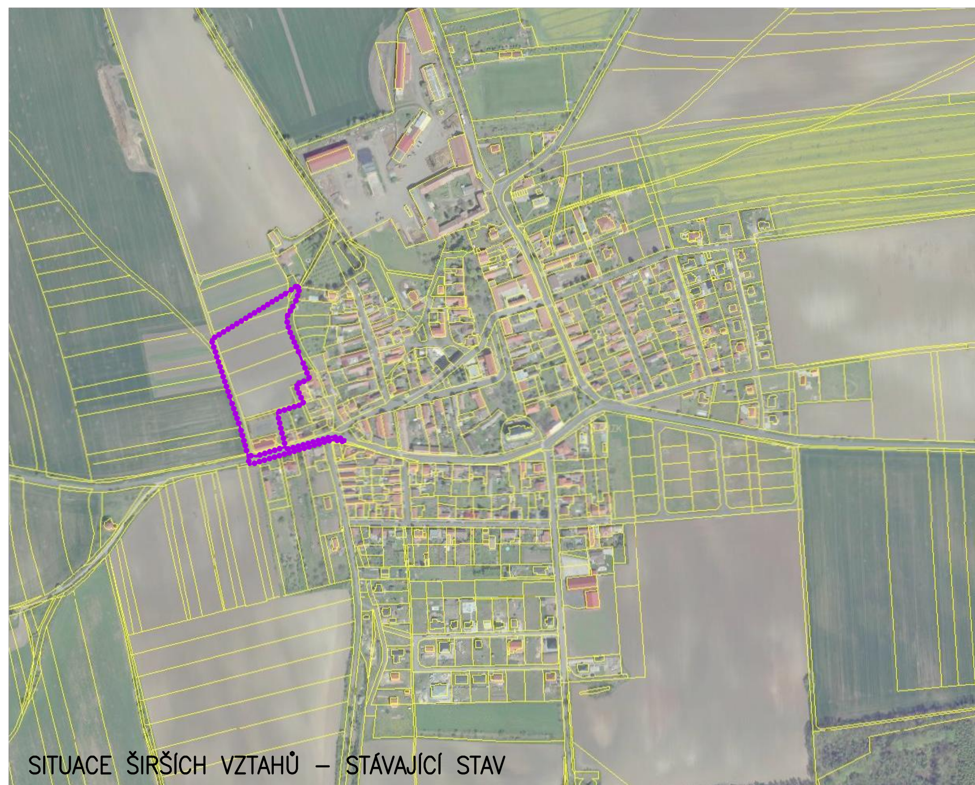
SITUACE ŠIRŠÍCH VZTAHŮ – STÁVAJÍCÍ STAV