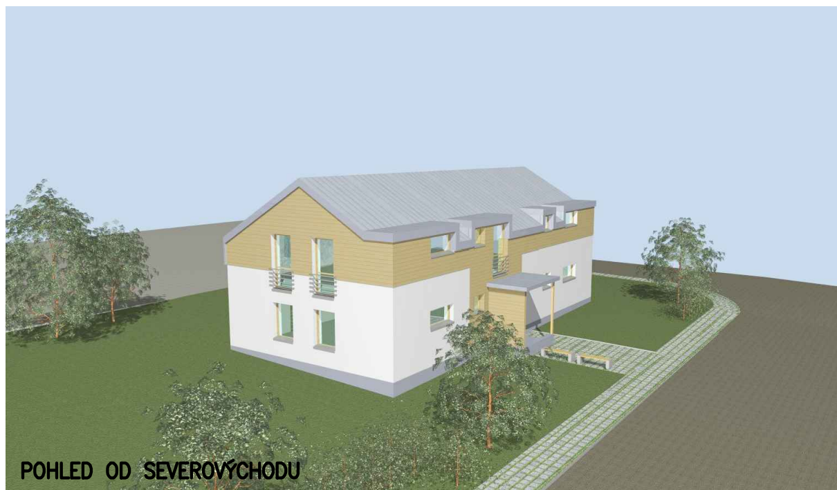
POHLED OD SEVEROVÝCHODU