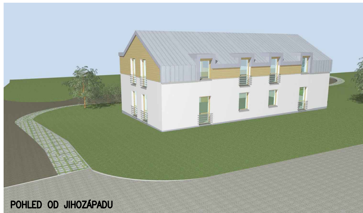
POHLED OD JIHOZÁPADU