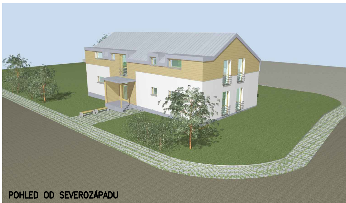
POHLED OD SEVEROZÁPADU